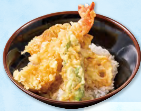
お子様海老天丼 三三二〇円