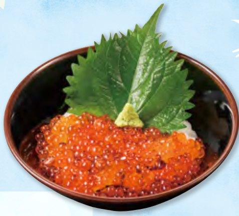
お子様いくら丼 四八〇円