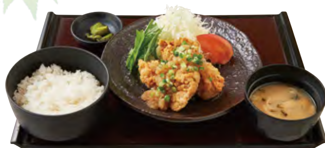
鶏の唐揚げおろしポン酢がけ定食

焼魚定食 一、二〇〇円 「焼き魚「山安干物 鯖」 「北海道仕込みにしんのみりん漬け焼き」 どちらかお選びください」