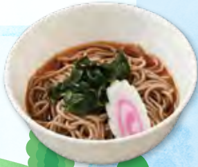
温冷 お子様そば 二五〇円