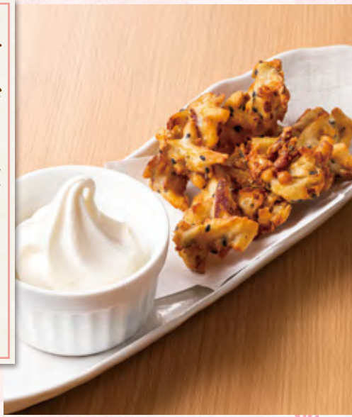
紅あずま芋フライの ソフトクリーム添え 三三八〇円